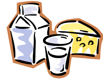
Leche o productos lácteos